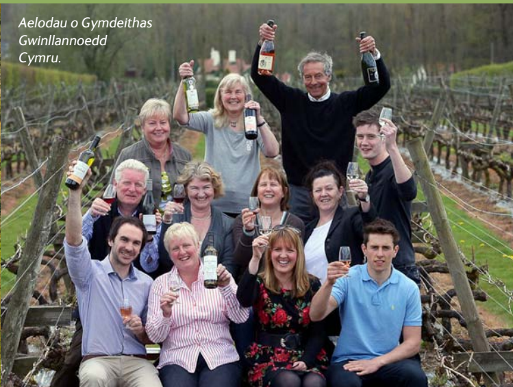
Aelodau o Gymdeithas Gwinllannoedd Cymru.

Ngwinllan Glynllanor ym Mro Morgannwg neu fwydo pâr o farcutiaid yng Ngwinllan Jabajak yn Sir Gaerfyrddin